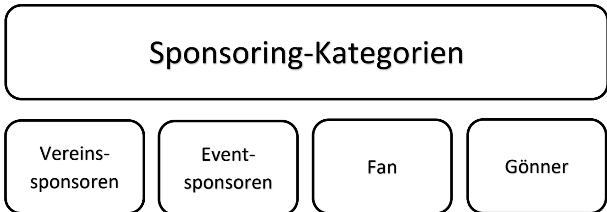
Abbildung 3: Sponsoring-Kategorien

Wir helfen sehr gerne bei der Ideenfindung und Umsetzung bzw. Gestaltung eines Inserats oder einer sonstigen Sponsoringmassnahmen. Die unten aufgezählten Leistungen können je nach Vertrag variieren – auch komplett individuelle Sponsoringpackages sind möglich. Zudem besteht für alle Sponsoren die Möglichkeit, Gutscheine oder Rabattaktionen für die Vereinsmitglieder des TVO anzubieten. Diese Angebote werden zum Beispiel über unsere Website und das inFORMiert kommuniziert.