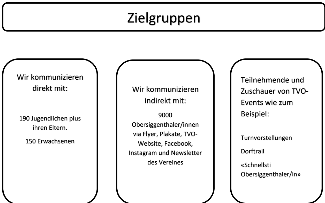
Abbildung 2: Zielgruppen

Mit diesen Plattformen erreichen wir durch die Grösse unseres Vereins viele Leute. Die Zielgruppen für die Kommunikation sind dabei die Folgenden: